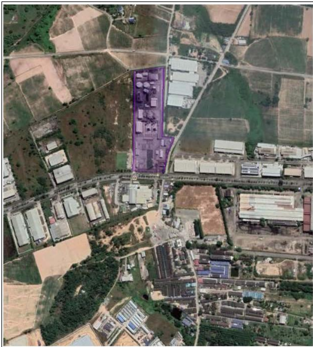
ภาพที่ 1.1 แผนที่แสดงตำแหน่งที่ตั้งโครงการ